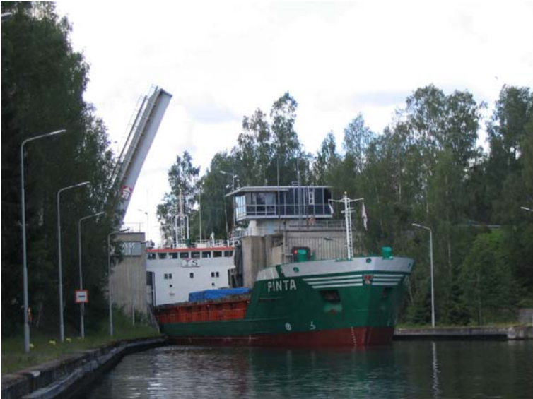
Kuva: Rahtialus Pinta Pällin sululla Saimaan kanavalla

oli maahantulotarkastus, viidennellä sululla (Pälli) taas lähtötarkastus; passit tarkastettiin heti sulun yläreunalla. Kanavassa kaikella rahtiliikenteellä on etuajo-oikeus, joten ohitettuamme erään rahtilaivan sulkujen välillä, se ohitti meidät sulun alapuolella, ajoi sulkuun ja täytti sen kokonaan, ja me odotimme kiltisti vuoroamme.. Puoli viiden aikaan taas Suomen puolella Nuijamaalla, ja illalla puoli kymmeneltä Lappeenrannassa, väsyneenä. Olimme nousseet 76 metriä ylöspäin merenpinnasta. Kanavalla emme kohdanneet ongelmia, mutta sulutus kahdeksasta sulusta ylös käy kyllä työstä. Meri-VHF:ssä kuului Viipurinlahdella lähinnä venäjää, mutta kanavalla se oli hyödyllinen väline tiedonkulkuun ja pääkielenä oli suomi.